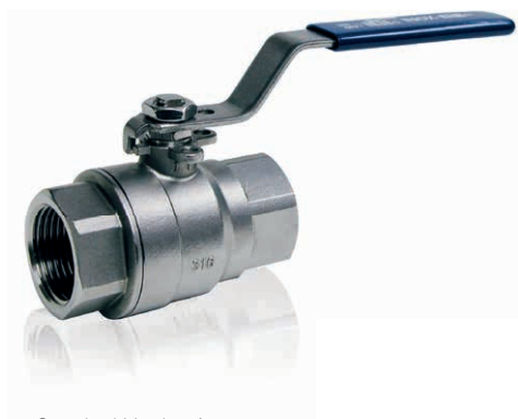
Standard-Version / Standard type

Kugelhähne 2-teilig, mit vollem Durchgang / Full bore ball valves, 2 pieces