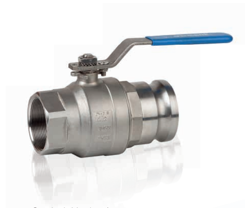
Camlock-Version / Camlock type